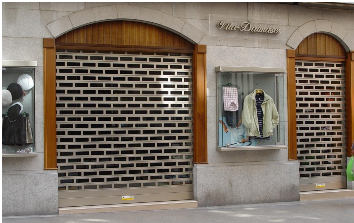
Mod. ASTRAL Anodisé INOX