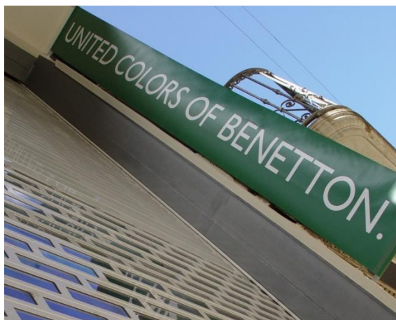
Mod. GLASS anodisé ARGENT MAT