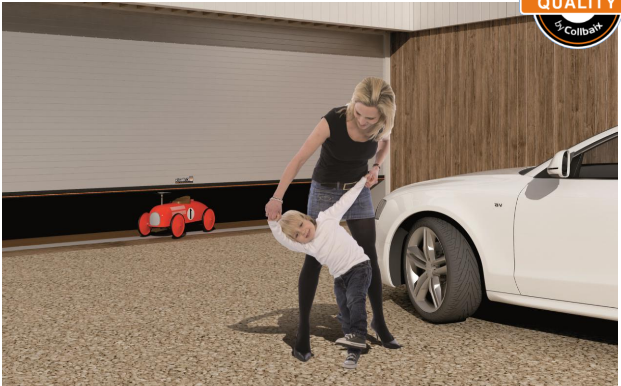
Mod. INNOVA LAQUÉE RAL 7048