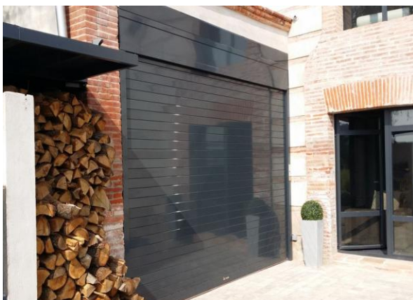
Mod. INNOVA RAL 7016

INNOVA de Collbaix, le meilleur rapport qualité-prix.