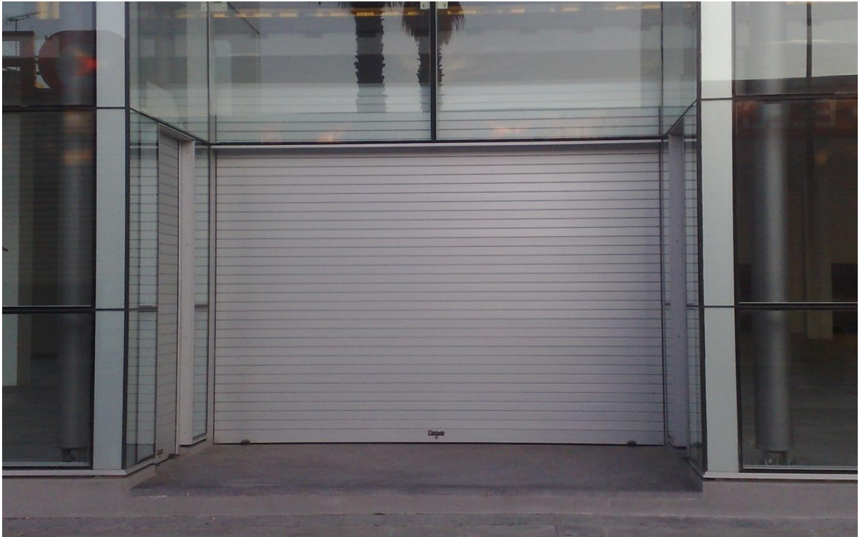
Mod. INNOVA anodisé Argent Mat