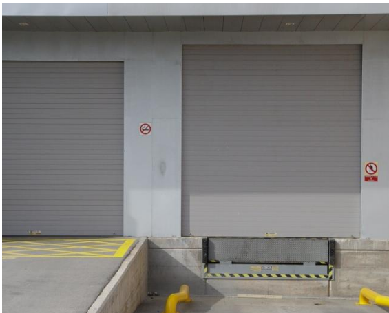
Mod. INNOVA laqué RAL 9006