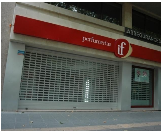
Mod. IRIS anodisé ARGENT MAT