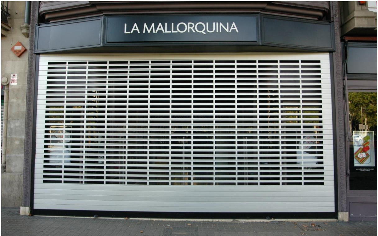
Mod. IRIS SPÉCIAL anodisé ARGENT MAT