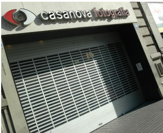
Mod. IRIS SPÉCIAL anodisé ARGENT MAT