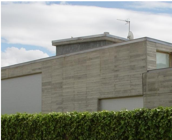
Mod. MASTER BLIND anodisé Argent Mat