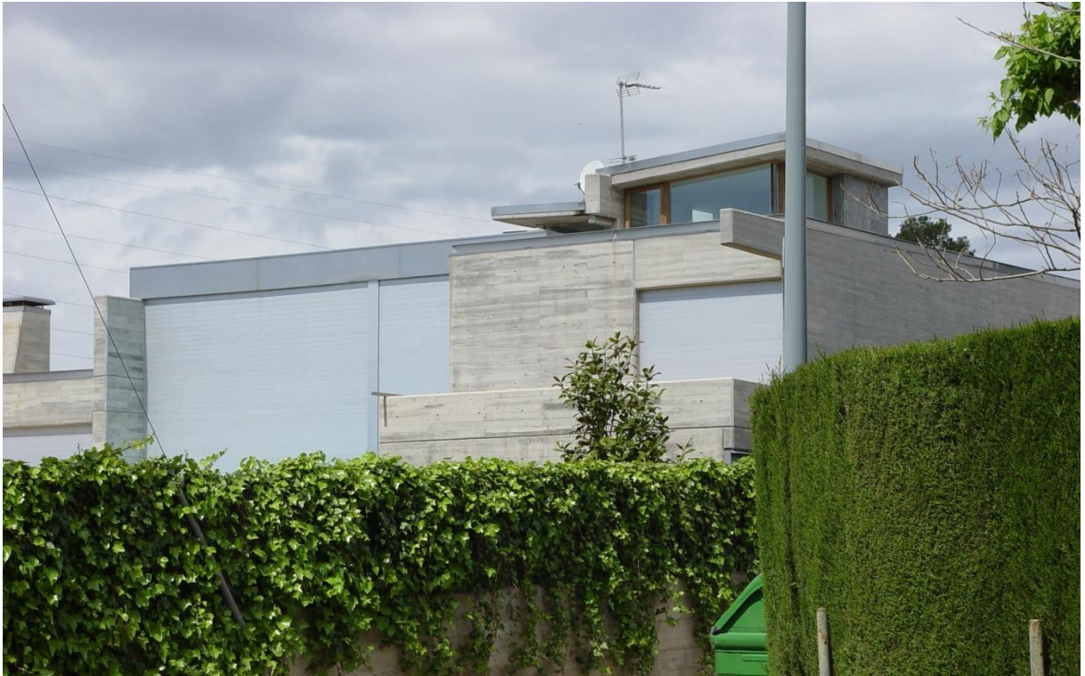
Mod. MASTER BLIND anodisé Argent Mat