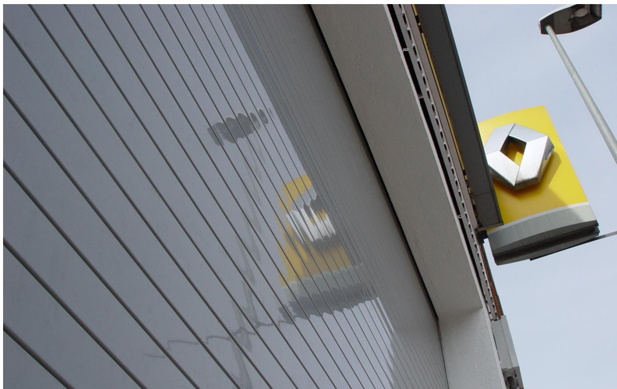
Mod. MASTER Laqué RAL Especial