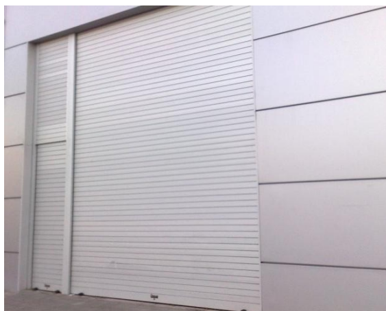
Mod. MASTER anodisé argent Mat