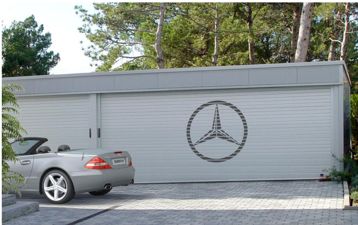
Mod. MATER DEKORA Anodisé Argent Mat