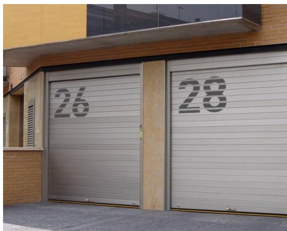
Mod. MATER DEKORA Anodisé INOX