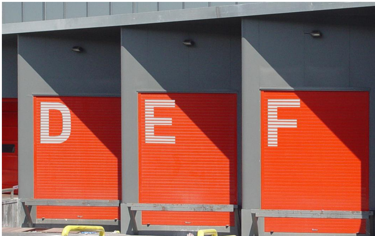
Mod. MASTER DEKORA Laqué RAL Special

Différenciez-vous des autres ou identifiez vos portes