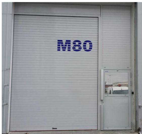
Mod. MASTER DEKORA laqué RAL 7035