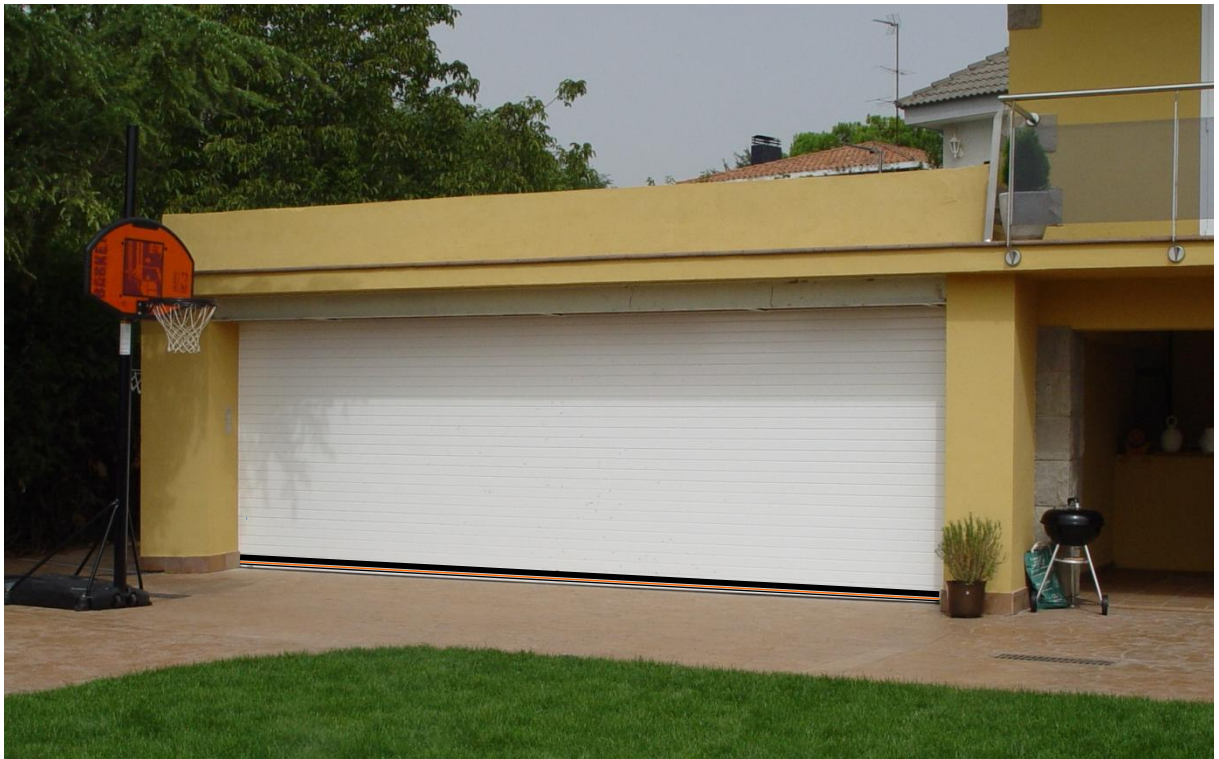
Mod. MASTER TERMIC Laqué en RAL 9010