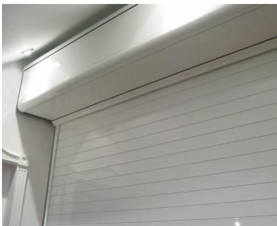
Caisson BASICPLUS en aluminium + Guides 95x40