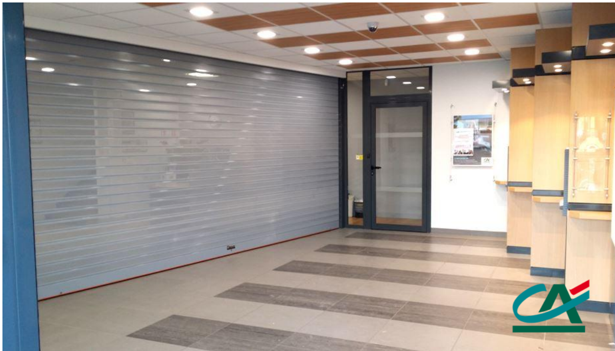
Mod. MICROBAIX anodisé ARGENT MAT