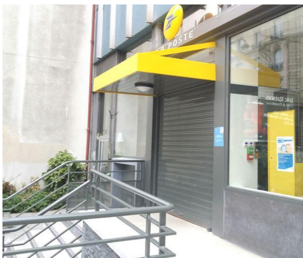
Mod. MICROBAIX anodisé ARGENT MAT