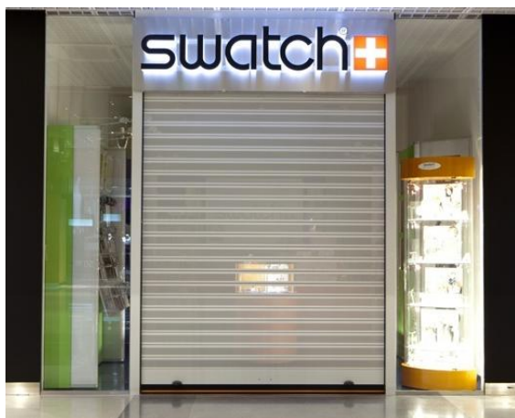
Mod. MICROBAIX anodisé ARGENT MAT