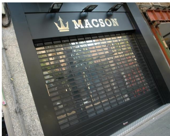
Mod. SATEN laqué Noir Mat