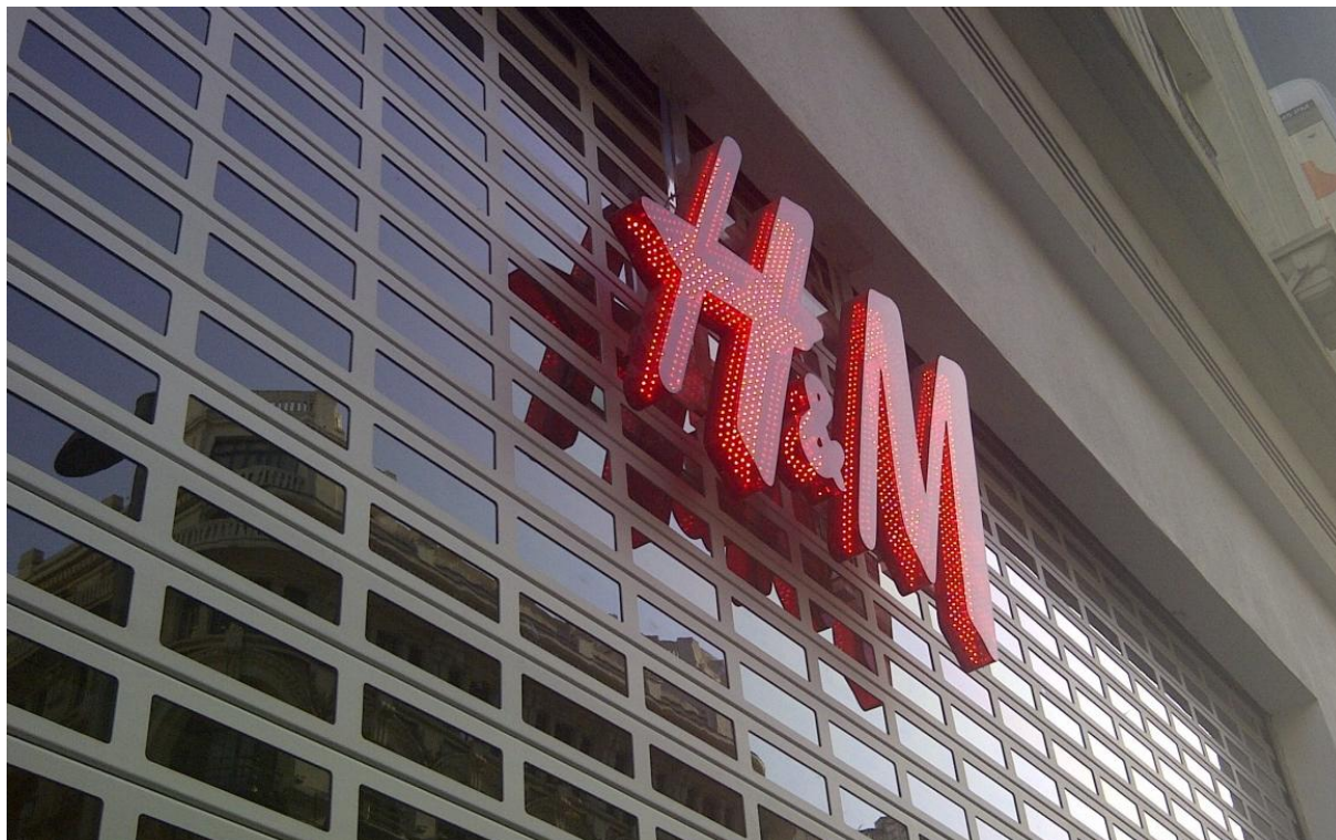
Mod. SATEN anodisé Argent Mat

Visibilité et protection contre l'air et l'eau pour votre commerce