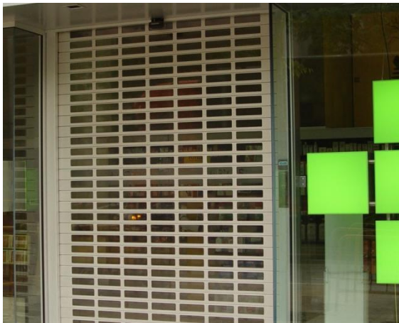
Mod. SEGURTRANS anodisé Argent Mat