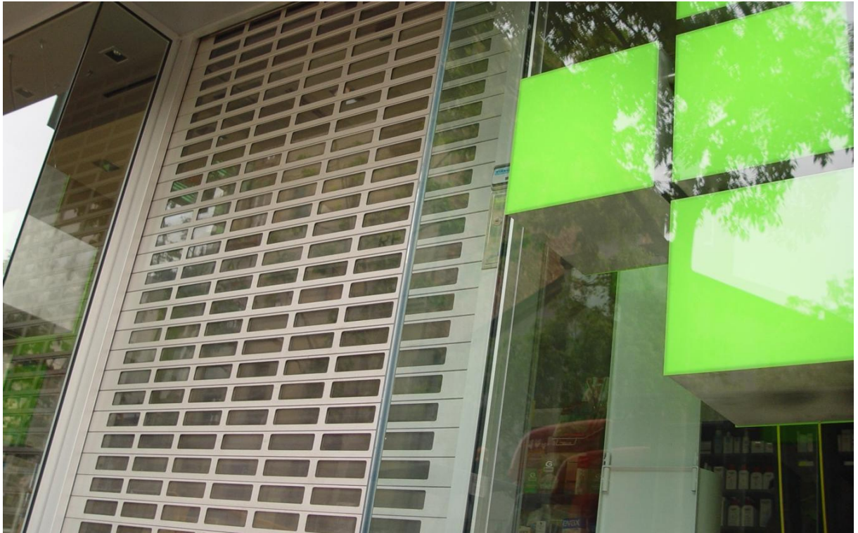
Mod. SEGURTRANS anodisé Argent Mat