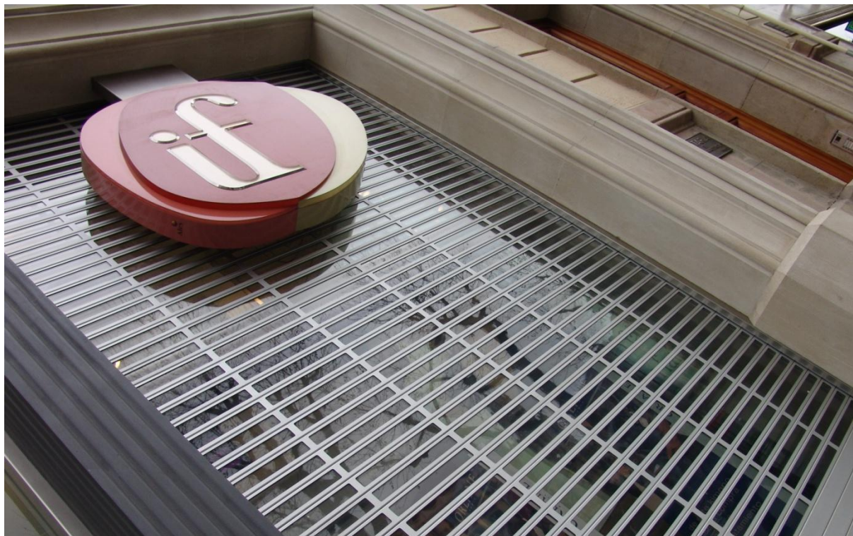
Mod. SEGURTRANS SPÉCIAL anodisé Argent Mat