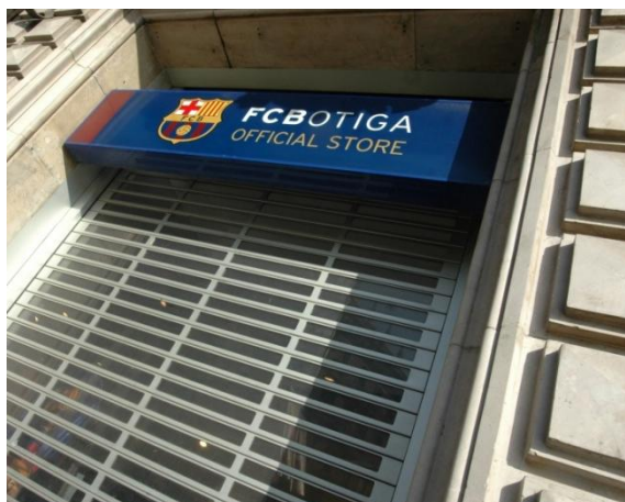
Mod. SEGURTRANS SPÉCIAL anodisé Argent Mat