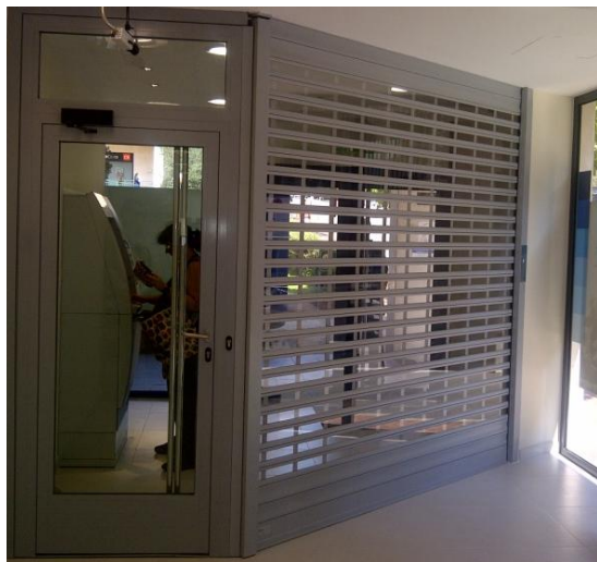
Mod. SECURBAIX BL VISION en Anodisé Argent Mat