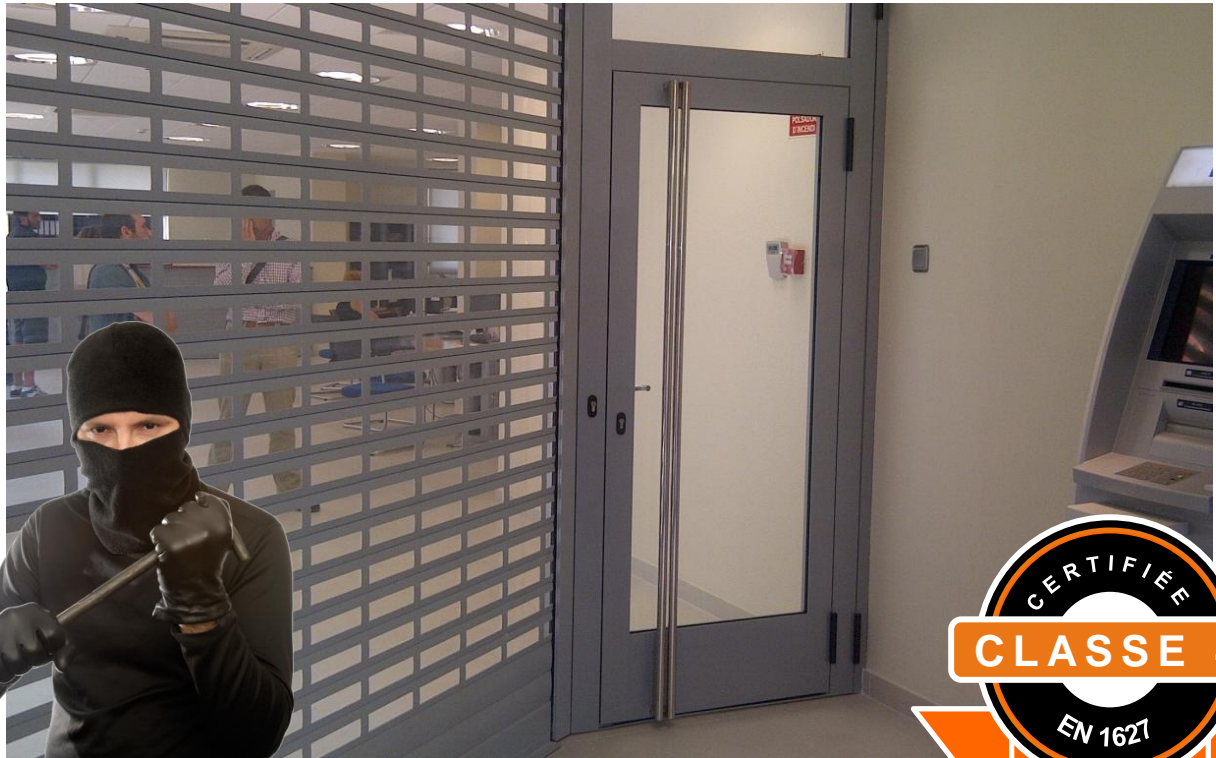
Mod. SECURBAIX BL VISION dans une agence bancaire

TRANSPARENCE combinée à une Sécurité Maximale Certifiée