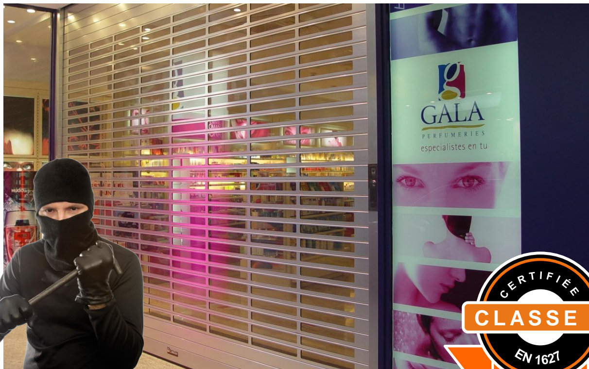
Mod. SECURBAIX BL VISION XL en Anodisé Argent Mat