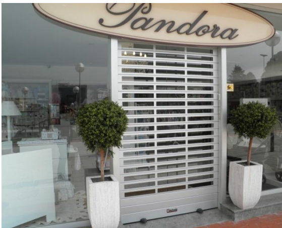
Mod. SATEN anodisé Argent Mat