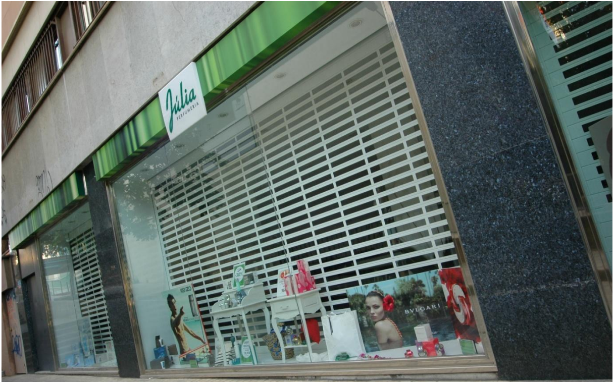
Mod. SATEN anodisé Argent Mat

Maximisez la visibilité de vos produits en les protégeant de l'eau et de la poussière